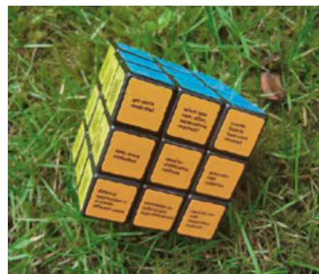
Figure 1: Le Living Lab Harmonization Cube

Le cyberspace est un lieu où la culture participative n'a cessé de se développer. Avec l'ère du Web 2.0 (environnement participatif et communautaire, essentiellement basé sur un contenu créé par l'utili-